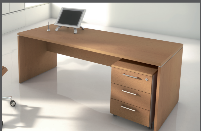
DESIGN:(BILAMINADO) BLANCO, WHITE, BLANC. (BILAMINADO) ALUMINIO , ALUMINIUM, (BILAMINADO) ARCE, MAPLE, ERABLE. (BILAMINADO) CEREZO, CHERRY, MERISIER